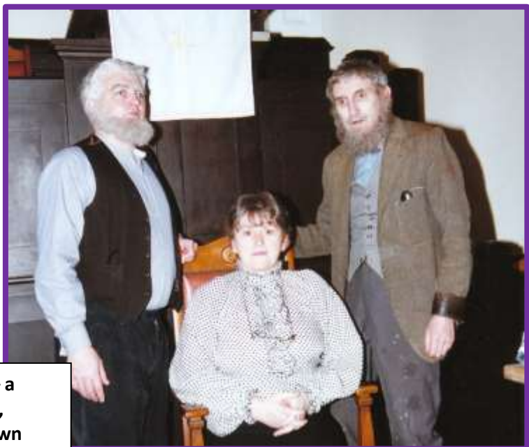
(dde) Cast o dri oedd i "Dwywaith yn Blentyn" – a rydyn ni'n credu i'r cynhyrchydd, Emyr Edwards, weithredu fel ein ffotograffydd ar gyfer y llun hwn