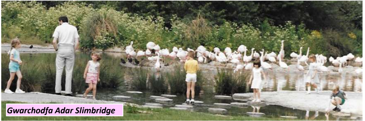
Gwarchodfa Adar Slimbridge

Rhyw fis neu ddau yn ôl bellach fe gyhoeddwyd yn y capel y byddai trip Ysgol Sul ar gyfer y plant yn cael ei drefnu ym mis Mai. 'Roedd angen casglu enwau er