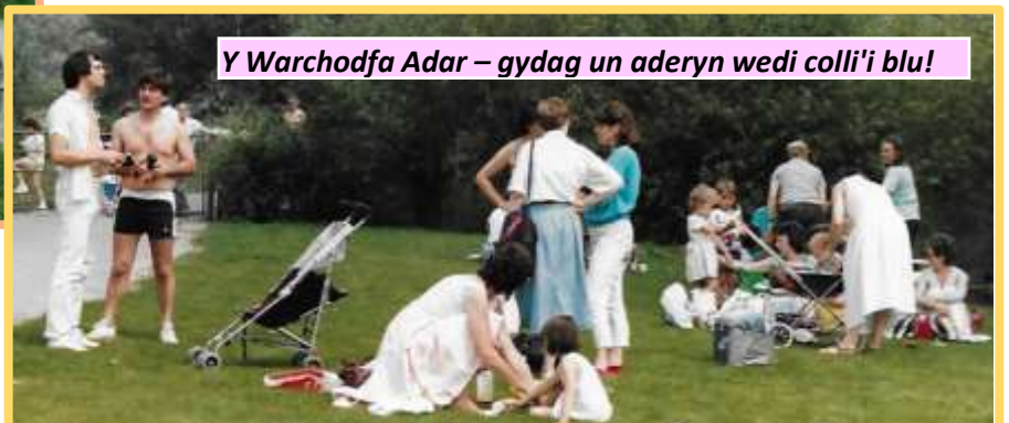
Y Warchodfa Adar – gydag un aderyn wedi colli'i blu!