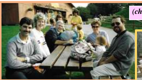
(chwith) Parc Hamdden Y Deri (Oakwood) lle bu i'r awdur wlychu ei hunan.