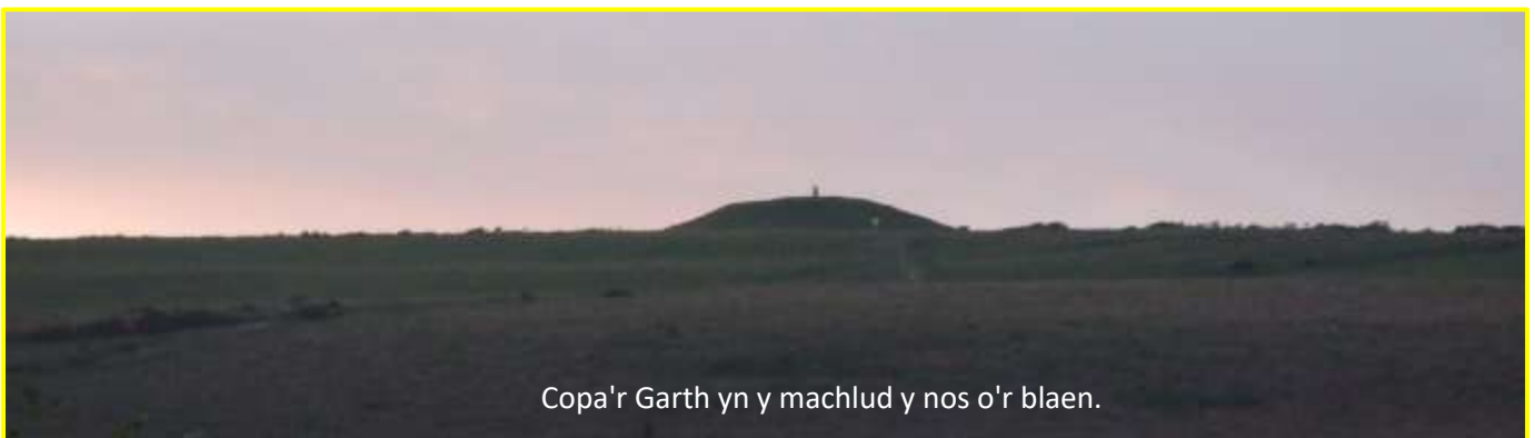
Copa'r Garth yn y machlud y nos o'r blaen.

Cawn gip ar furiau mud Capel Taihirion, ger Rhydlafer, y bu'r achos a sefydlwyd yno yn gymaint ei ddylanwad ar gynulleidfaoedd a chapeli eraill y cylch ers oddeutu 1760.