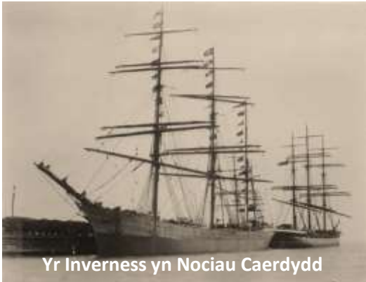
Yr Inverness yn Nociâu Caerdydd

Aeth can mlynedd mynd heibio ers i griw bach o forwyr (llawer ohonyn nhw'n Gymry) gychwyn ar eu taith ar y barque 'Inverness' o ddociau Caerdydd, heibio Durban, ar draws Cefnfor yr India, heibio Awstralia, gan anelu am Chile. Yn anffodus, chyrrhaeddodd nhw mo Chile gan fod cargo'r llong wedi tanio yng nghanol y Môr Tawel ('spontaneous combustion') a bu'n rhaid i'r criw ddianc mewn dau fad achub bychan ac anelu am y darn tir agosaf oedd 650 milltir i ffwrdd.