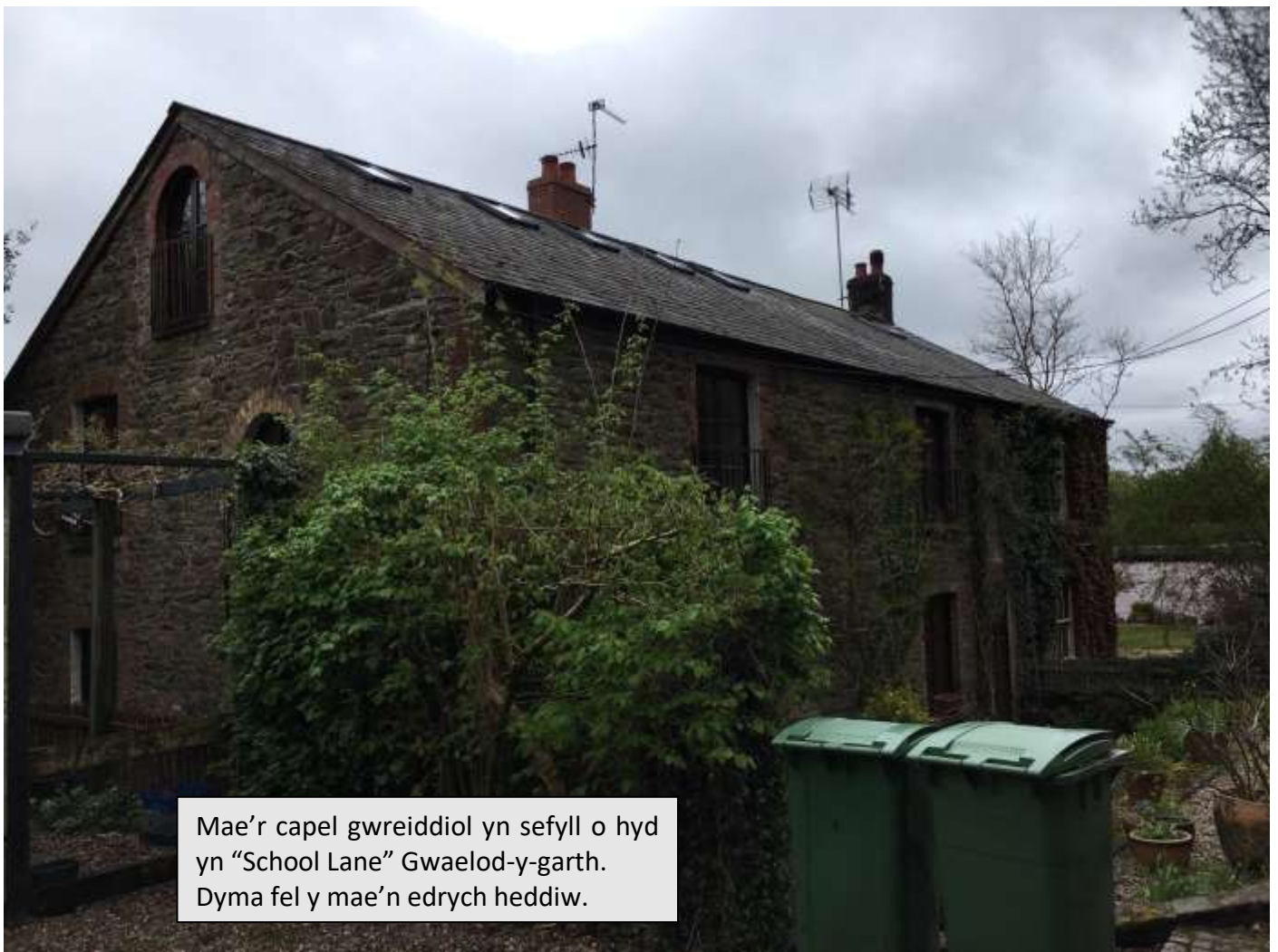
Mae’r capel gwreiddiol yn sefyll o hyd yn “School Lane” Gwaelod-y-garth. Dyma fel y mae’n edrych heddiw.

Yn ystod yr wythnos [er y flwyddyn 1820] arferent ddod at ei gilydd yn un o’r tai a elwid “Tai’r Lefel” yn agos at y “gwaith” i gynnal cwrdd Gweddi a chyfeillach. Ond os oeddynt am Gymun neu fedydd yna rhaid oedd mynd i’r Taihirion neu’r Groeswen. Dyna oedd y ddau le agosaf lle gallai’r bobl hynny ymaelodi mewn Eglwys o’r un egwyddorion a hwy eu hunain. Yn naturiol teimlent y ffordd yn hir ac yn flinedig, yn arbennig felly yn