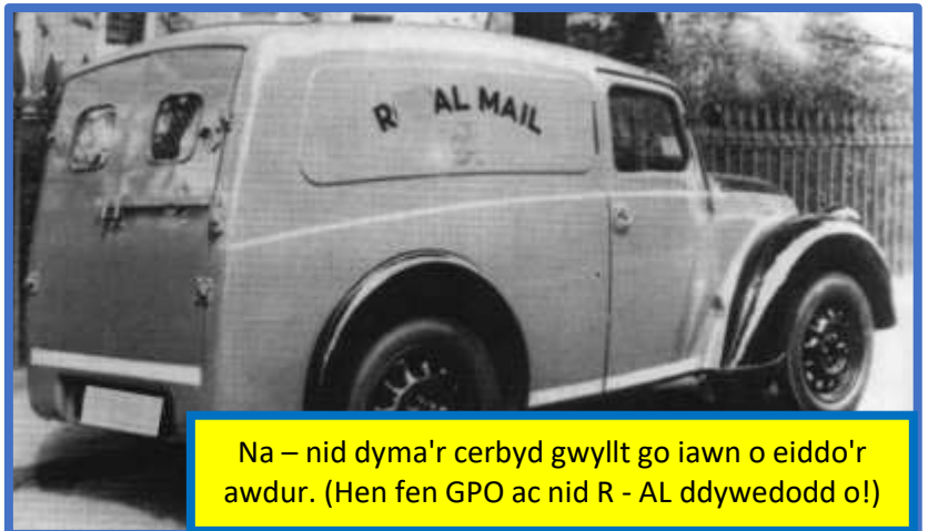
Na – nid dyma'r cerbyd gwyllt go iawn o eiddo'r awdur. (Hen fen GPO ac nid R - AL ddywedodd o!)