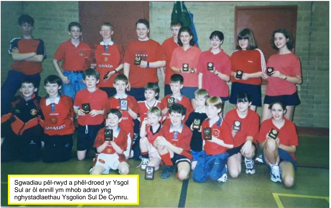
Sgwadiau pêl-rwyd a pêl-droed yr Ysgol Sul ar ôl ennill ym mhob adran yng nghystadlaethau Ysgolion Sul De Cymru.