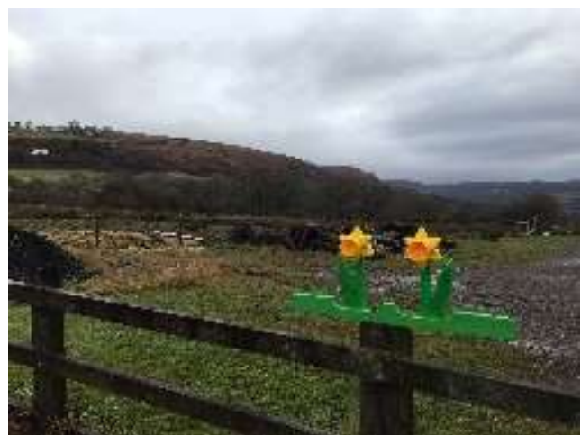
Mae ein 'paparazzi' lleol yn sylwi ar bopeth! Megis y newid fu adeg Gŵyl Ddewi ar y llwybr tua copa'r Garth.