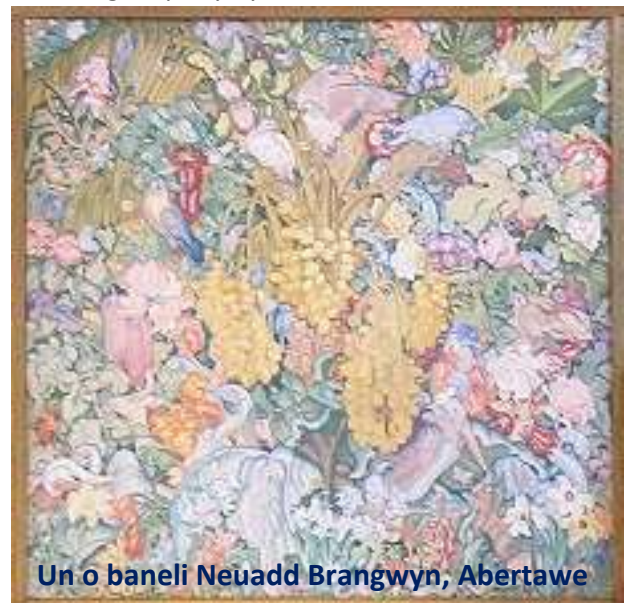
Un o baneli Neuadd Brangwyn, Abertawe

A dyna sut daeth Neuadd yn Abertawe i fod yn gartref gweithiau addurniadol gan artist sydd o bwys a diddordeb rhyngwladol.