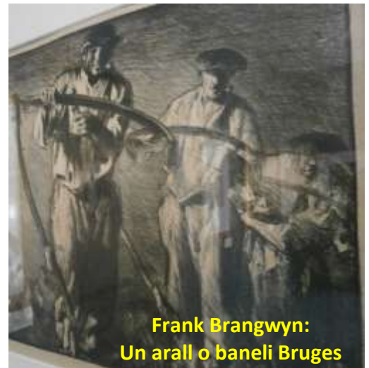
Frank Brangwyn: Un arall o baneli Bruges

Dechreuodd ei ddiddordeb mewn paentio murluniau yn 1895 pan ofynnwyd iddo gan Siegrid Bing gwerthwr lluniau, beintio murlun ar waliau allanol Maison de L'Art Nouveau ym Mharis ac yna gweithiodd ar baneli mawr Neuadd Skinners yn