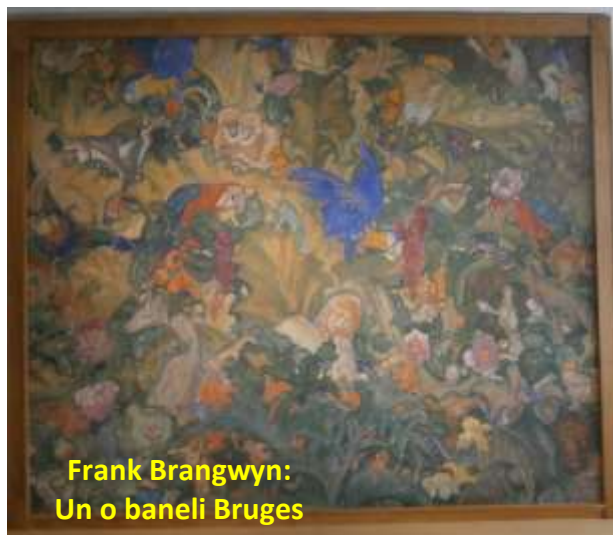
Frank Brangwyn: Un o baneli Bruges

Yn 15 oed daeth o dan ddylanwad William Morris lle bu'n brentis ddrafftsmon ifanc yn ei fusnes yn Llundain. Dechreuodd ei yrfa yn Llundain yn cynllunio adeiladau crefyddol. Roedd yn artist amryddawn yn gweithio mewn aml gyfryngau ac yn gallu troi ei law at unrhywbeth; cynllunio ffenestri lliw a gwaith serameg, yn ysgythrwr, yn ddylunydd coed a chelfi, yn lithograffydd ac yn arlunydd toreithiog.