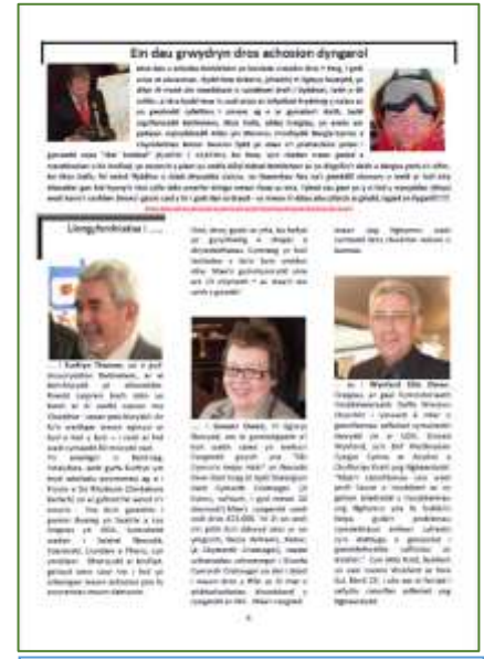
Tudalen 6 Gwanwyn 2010

Gellid bod wedi ychwanegu at y rhestr uchod yn hawdd iawn, ond dwi'n sicr y bydd y neges wedi'n cyrraedd yn glir – dyma fydd y sialens a'r her i ni WCC. Fyddwch chi'n barod i fod yn rhan o'r gêm?