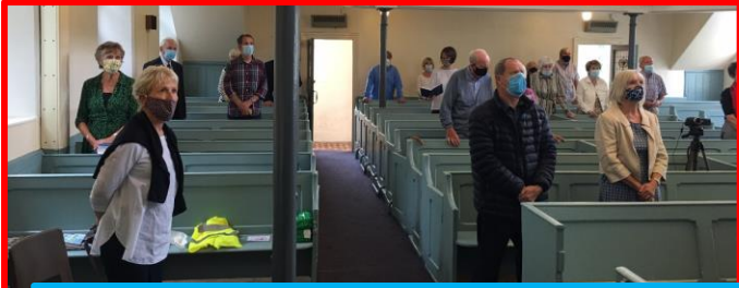
Dyma sut roedd pethau ar ddechau Gorffennaf – ein Sul cyntaf wedi'r paentio!