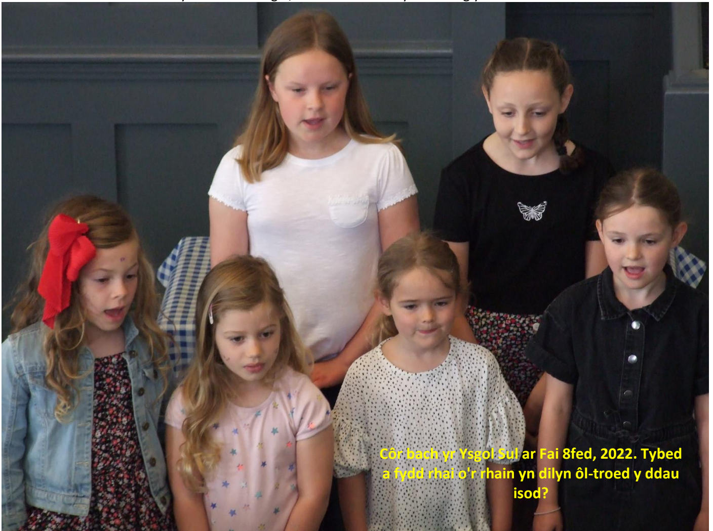
Côr bach yr Ysgol Sul ar Fai 8fed, 2022. Tybed a fydd rhai o'r rhain yn dilyn ôl-troed y ddau isod?

Diolch i bawb sydd wedi cyfrannu pob gair a llun i'r rhifyn hwn. Dyma ddau lun i gloi'r rhifyn – y naill o'r oedfa Cymorth Cristnogol, a'r llall o unawdwyr "Teilwng yw'r Oen":