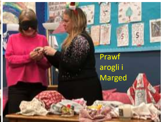
Prawf aroglu i Marged