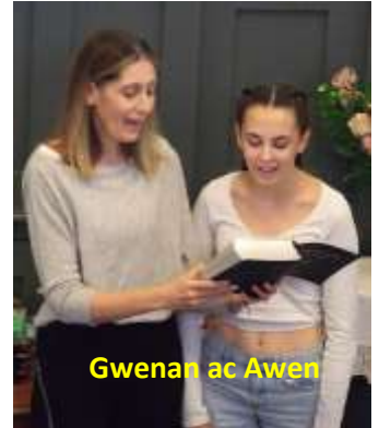
Gwenan ac Awen